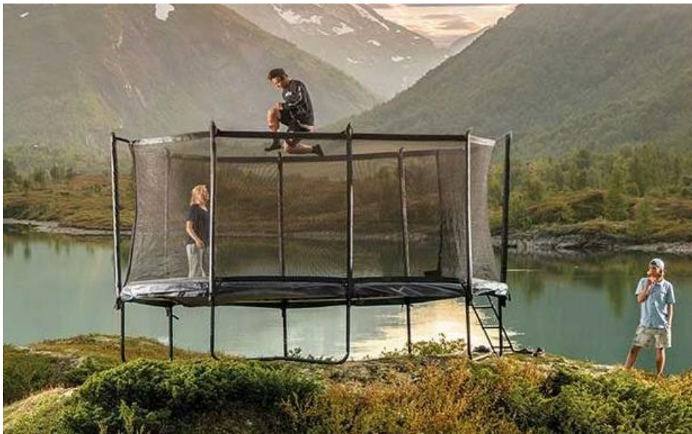
North Trampoline Rund 430 cm diameter . ca 14'000 kr

”Önskar att samfälligheten köper in en studsmatta till lekplatsen för att öka lekplatsens attraktionsvärde. Den ska vara av hög kvalitet så att den passar områdets barn och ungdomar. Förslagsvis kan den förvaras vintertid i Diamanten. Ungefärlig kostnad 10000-15000 kr.”