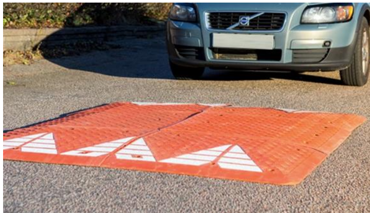
Pris från 13'100 kr / hinder