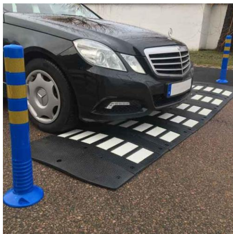
Pris från cirka 5800 kr / hinder